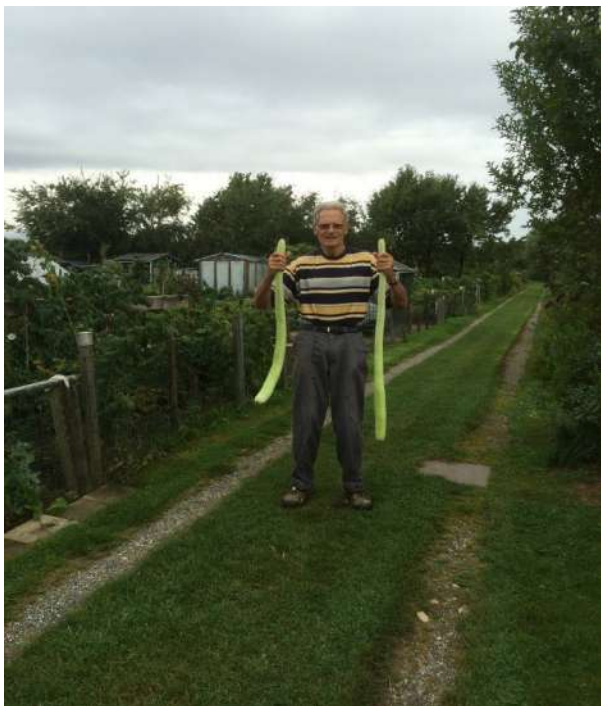
De grote courgette