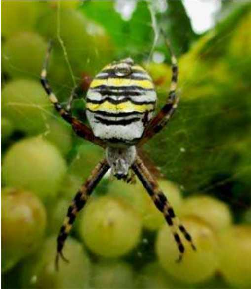
Een tijgerspin die in het najaar zijn web maakt